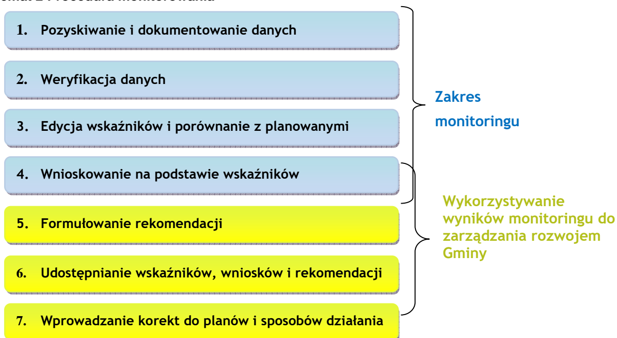
Schemat 2 Procedura monitorowania